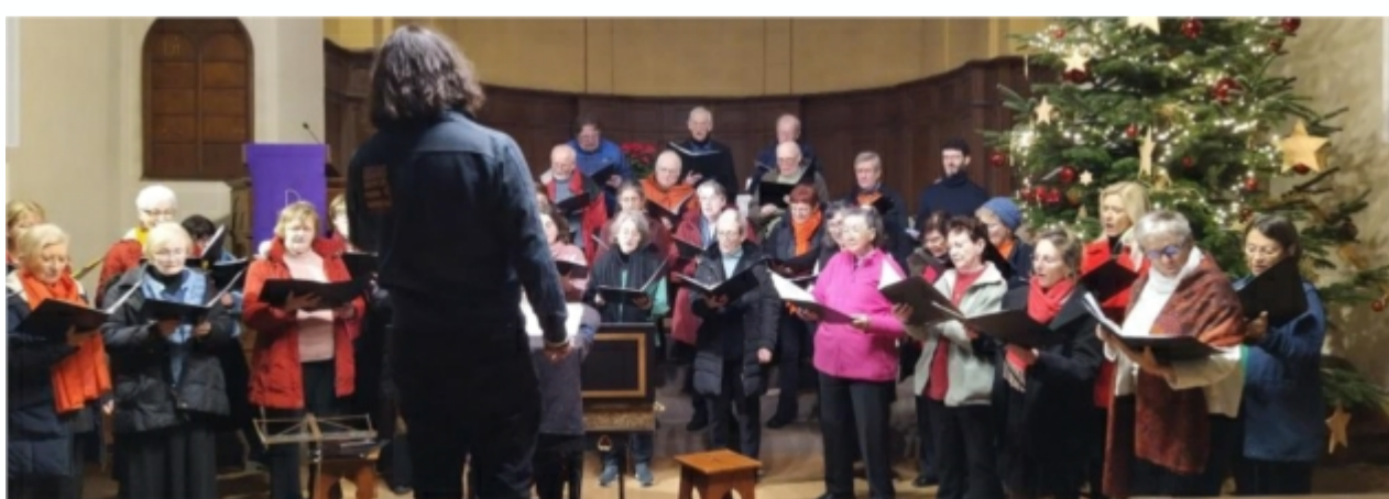
lors de la générale à l'église de Munster le samedi 31 décembre

Et ci-dessous l'article de presse d'après concert du 4 janvier 2024 rédigé par Monsieur Eddy Herrmann